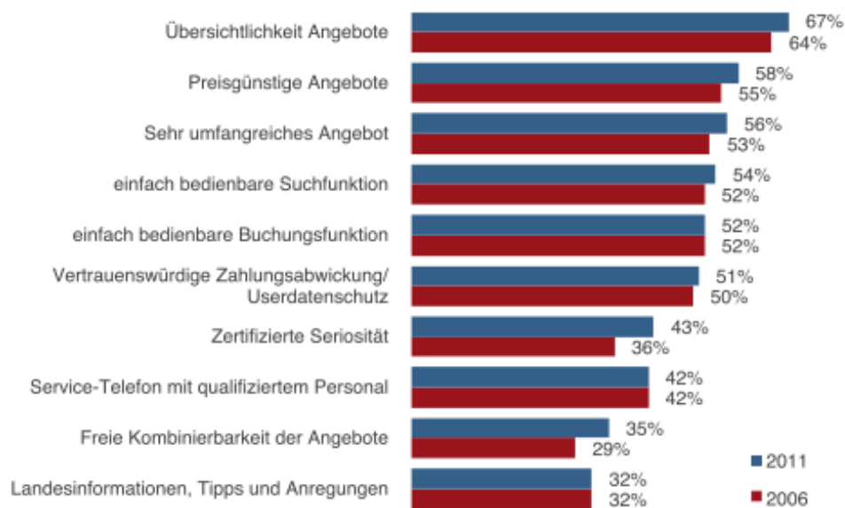
Abb. 3: Anforderungen an ein Online-Reisebüro (Verband für Internet Reisevertrieb 2012)

(Basis: deutschsprachige Onliner 14+ Jahre, 2006 nur Deutsche)