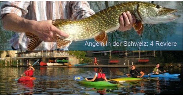
Angeln in der Schweiz: 4 Reviere

Sporthotel mit Wellnesspool, Romantikhotel, günstige Gasthöfe und 2 Gruppenzeltplätze, sowie Lagerhäuser! Aktive, aber trotzdem entspannende Ferien und Vereinsausflüge. Über 150 Ausflüge www.pro-wasseramt.ch